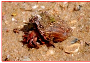
Caranguejo-ermiteira (Crustáceos de corpo mole que se protegem em búzios vazios)