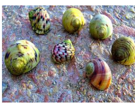
Caracol do mar (ou burrié - Moluscos gastrópodes)