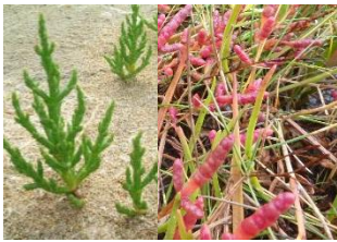
Salicornia sp. (Planta que se desenvolve em ambientes salinos)