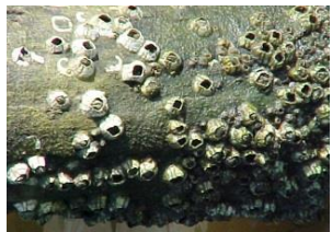
Cracas (Crustáceos com exosqueleto calcificado)