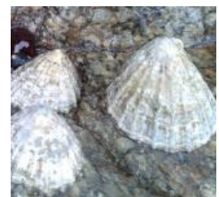
Lapa (Moluscos Gastrópodes)