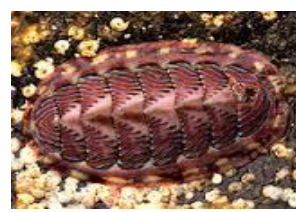
Quitone (Molusco com concha formada por 8 placas calcárias)