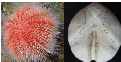
Ouriços do mar