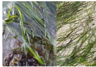
Angiospérmicas marinhas (Ervas marinhas das espécies - Zostera sp. ou Cymodocea sp. )