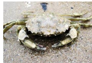
Caranguejos (Crustáceos com carapaça e cinco pares de patas)