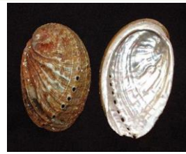
Haliotis sp. (Abalone ou orelha de Neptuno - Moluscos Gastrópodes)