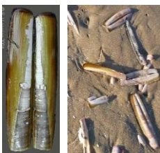
Lingueirão (ou navalha - Moluscos Bivalves)