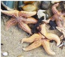
Estrelas do mar