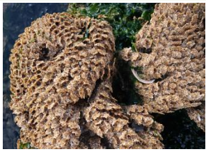
Anelídeos ( Sabellaria ) Poliquetas (vermes) que vivem em tubos de areia