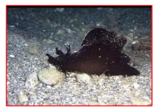
Aplysia sp. (Vinagreira ou Lebre do mar - Gastrópode que emite um líquido roxo quando ameaçado)