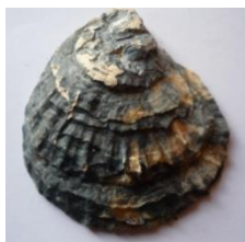
Ostras (Moluscos Bivalves)