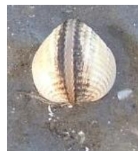
Berbigão (Moluscos Bivalves - 2 conchas com nervuras)