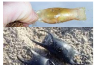
Cápsulas de ovos de tubarões e raias