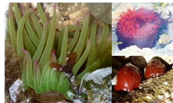
Anêmonas (Capturam alimento com os seus tentáculos)