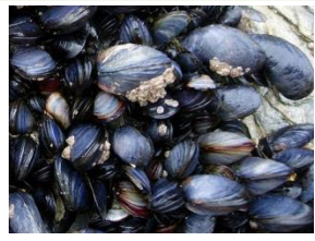
Mexilhões (Moluscos Bivalves)