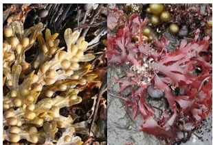
Algas castanhas ou vermelhas