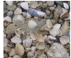
Depósitos de conchas e búzios