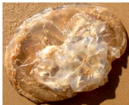
Alforrecas (forma de vida livre de cnidários adultos)